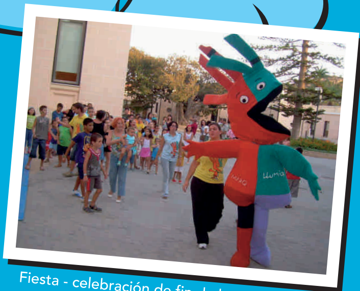
Fiesta - celebración de fin de la campaña de actividades de verano

Un verano más el Club Llumiq ha propuesto un amplio repertorio de actividades para todos vosotros. La respuesta como siempre ha sido extraordinaria, con el aforo del aula didáctica completa todos los días.